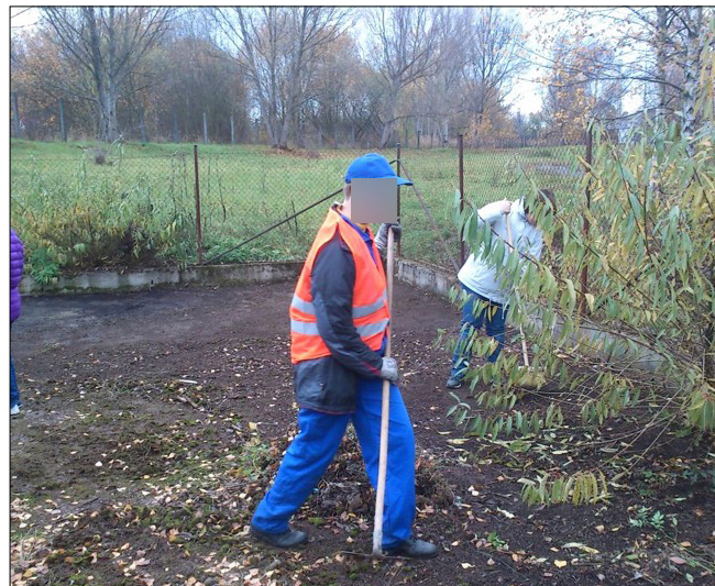
Tranzitní program – pomocné úklidové práce