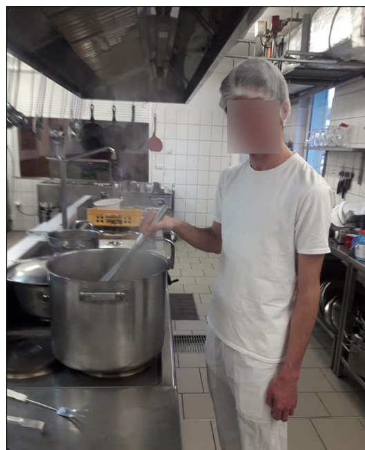
Tranzitní program – pomocné práce v kuchyni