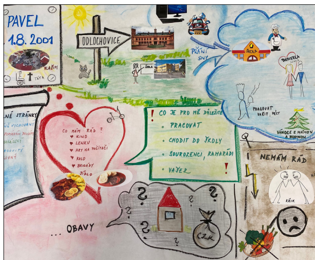
Pavlova mapa – plánování

Během studia si osvojil mnoho nových dovedností a osamostatnil se. Bydlí na chráněném bytě, dojíždí samostatně do školy, má mnoho zájmů a přátel.