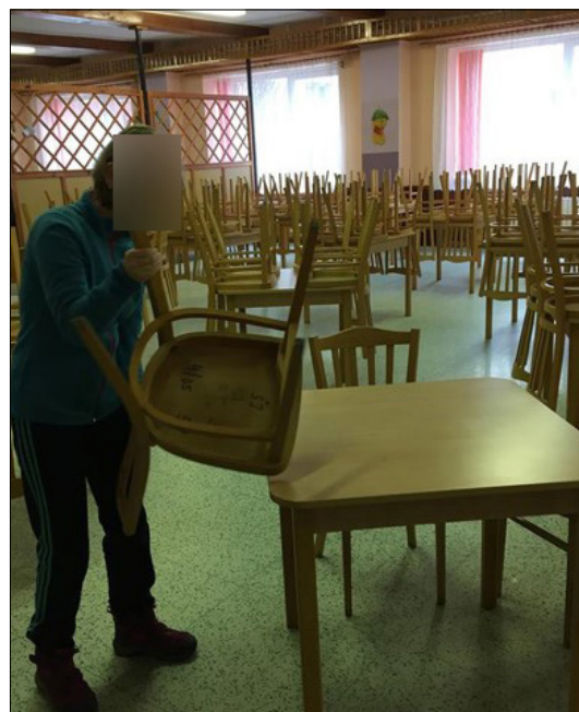
Tranzitní program – pomocné práce ve školní jídelně

Studentka nebyla schopna nacvičit a osvojit si pracovní činnosti. Ani časté opakování nevedlo k osvojení si pracovních dovedností. Rychle zapomíná a nedokáže činnosti ve vhodnou chvíli využít, použít v praxi. Má nedostatek iniciativy, vůle, je nesamostatná a není schopna překonávat překážky, řídit vlastní jednání. Ve všech činnostech potřebuje přímou pomoc asistenta. V současné době hledáme vhodný stacionář a vhodné aktivizační činnosti.