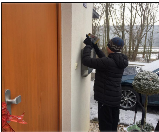
Tranzitní program – roznos letáků

Situace v této oblasti se výrazně změnila především ve smyslu složení studentů ve třídě. Dříve přicházeli žáci do praktické školy dvouleté převážně s „lehčími handicapy“, např. lehkým mentálním postižením v kombinaci s dalším zdravotním postižením. V současné době zde převažují žáci se středně těžkým stupněm mentálního postižení a autismem. Úspěšnost žáků s uplatněním se podle mého názoru zhoršuje. Souvisí to především s těžším stupněm postižení (viz výše). Pokud student práci najde, udržitelnost je špatná (viz např. příběh studenta Jirky). Žáci nacházejí uplatnění především jako pomocní pracovníci. Vykonávají nejrůznější úklidové práce nebo pomocné práce v kuchyni. Oblíbený je také roznos letáků nebo doplňování zboží.